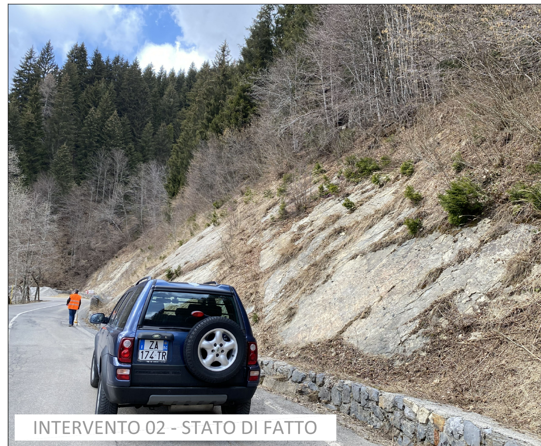
INTERVENTO 02 - STATO DI FATTO