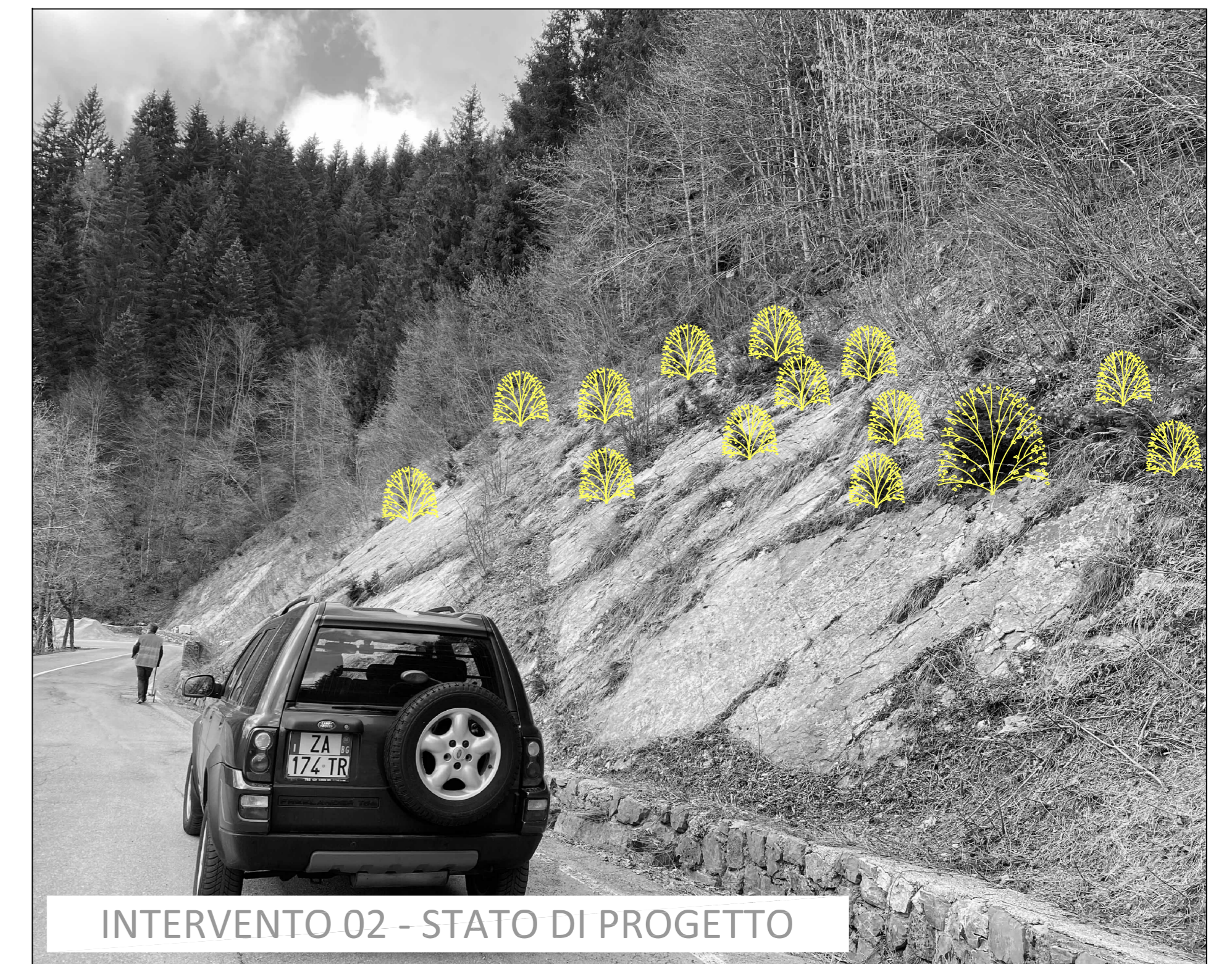
INTERVENTO 02 - STATO DI PROGETTO

ESTRATTO CARTA TECNICA REGIONALE scala 1:10.000