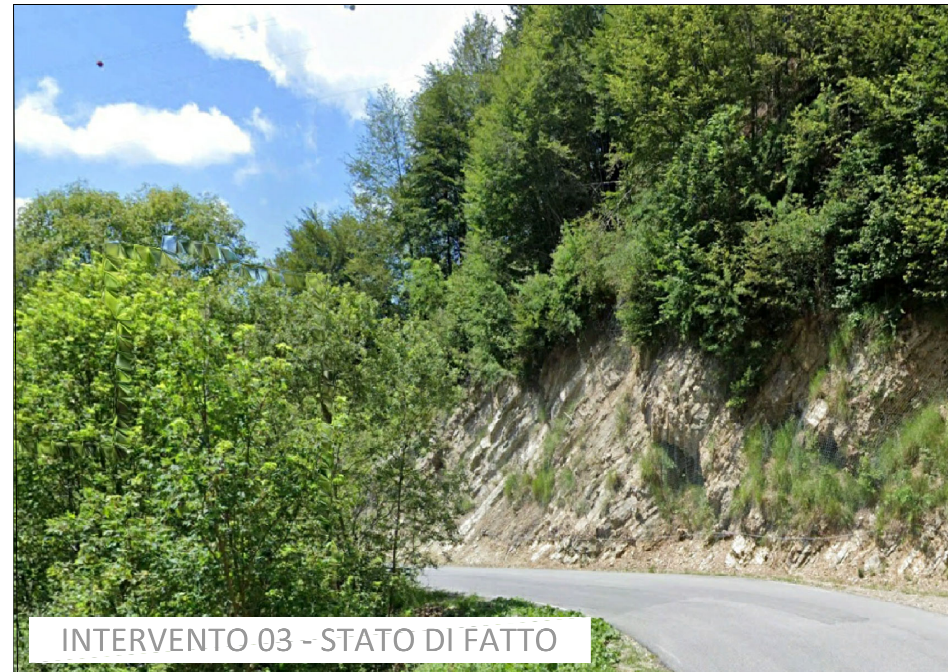
INTERVENTO 03 - STATO DI FATTO