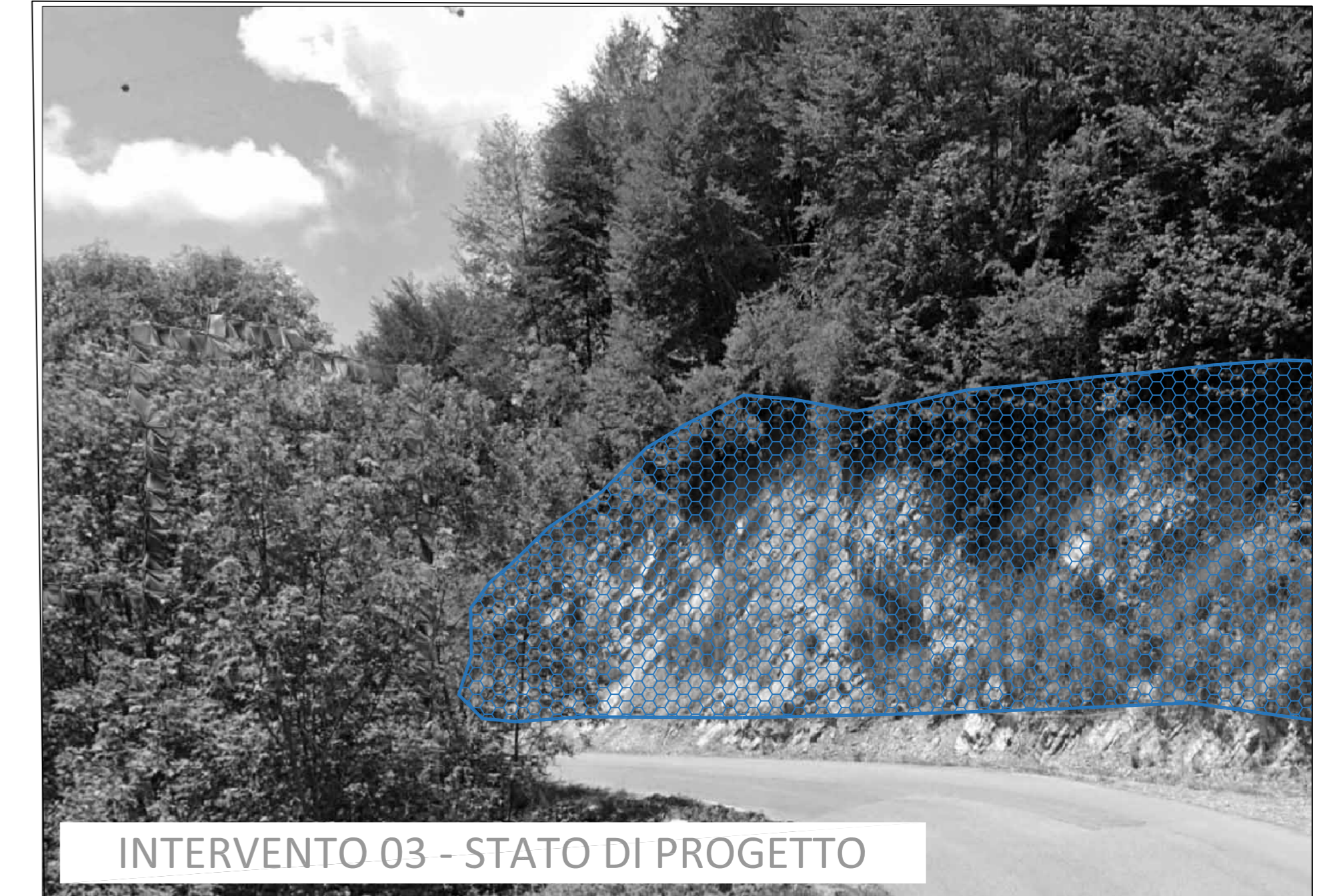
INTERVENTO 03 - STATO DI PROGETTO

ESTRATTO CARTA TECNICA REGIONALE scala 1:10.000