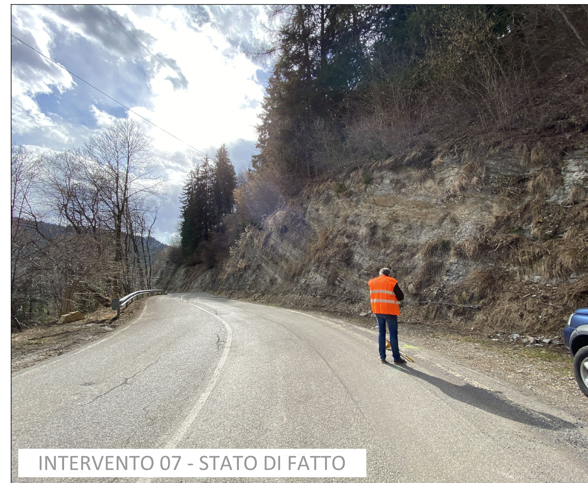
INTERVENTO 07 - STATO DI FATTO