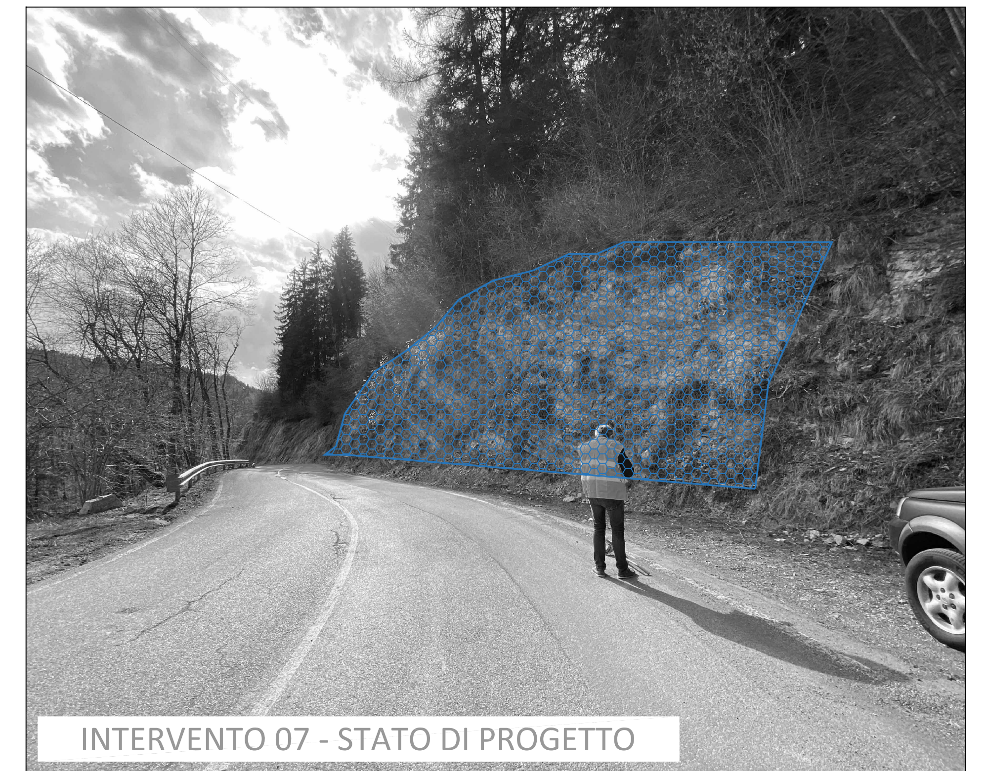
INTERVENTO 07 - STATO DI PROGETTO

ESTRATTO CARTA TECNICA REGIONALE scala 1:10.000