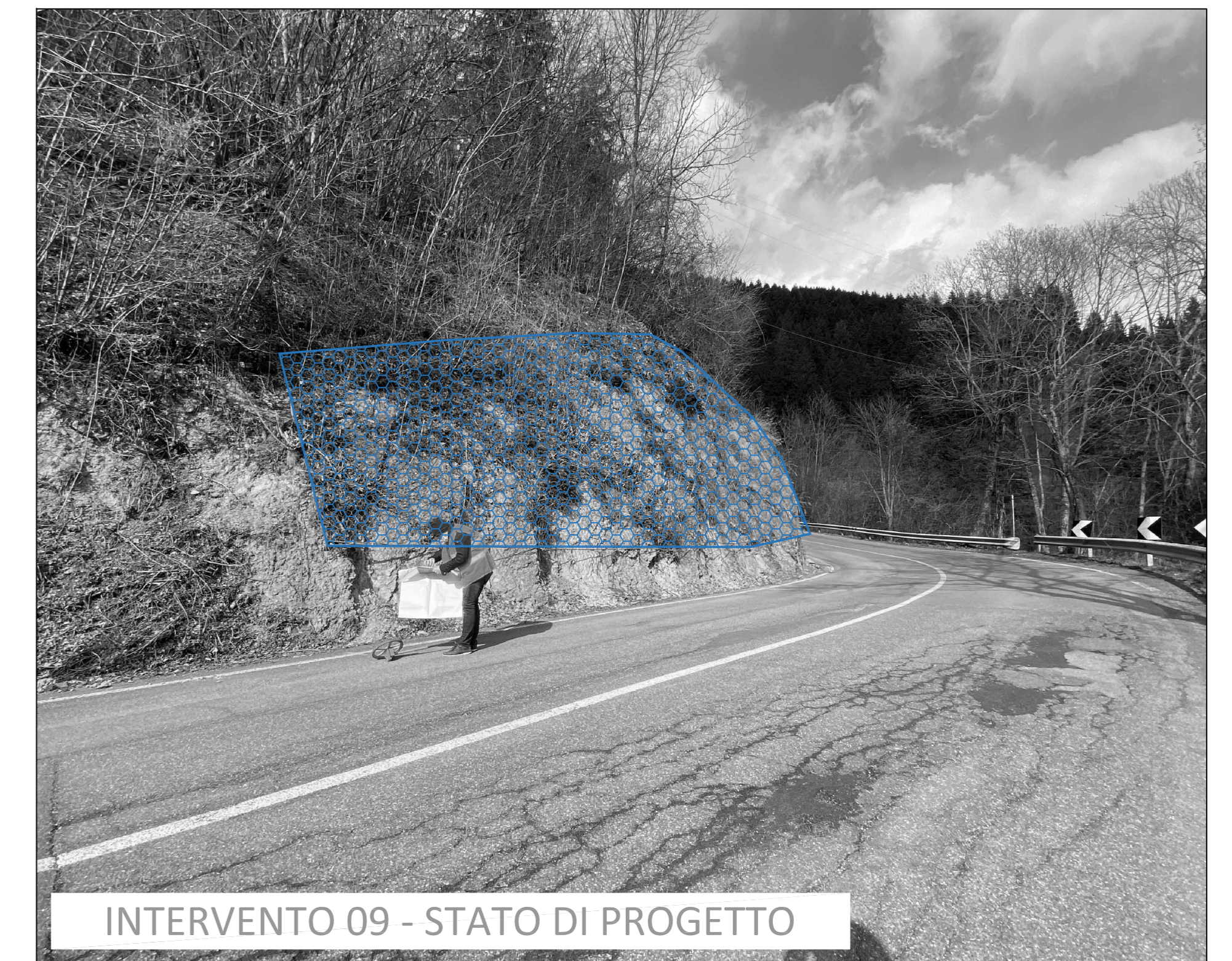
INTERVENTO 09 - STATO DI PROGETTO

ESTRATTO CARTA TECNICA REGIONALE scala 1:10.000