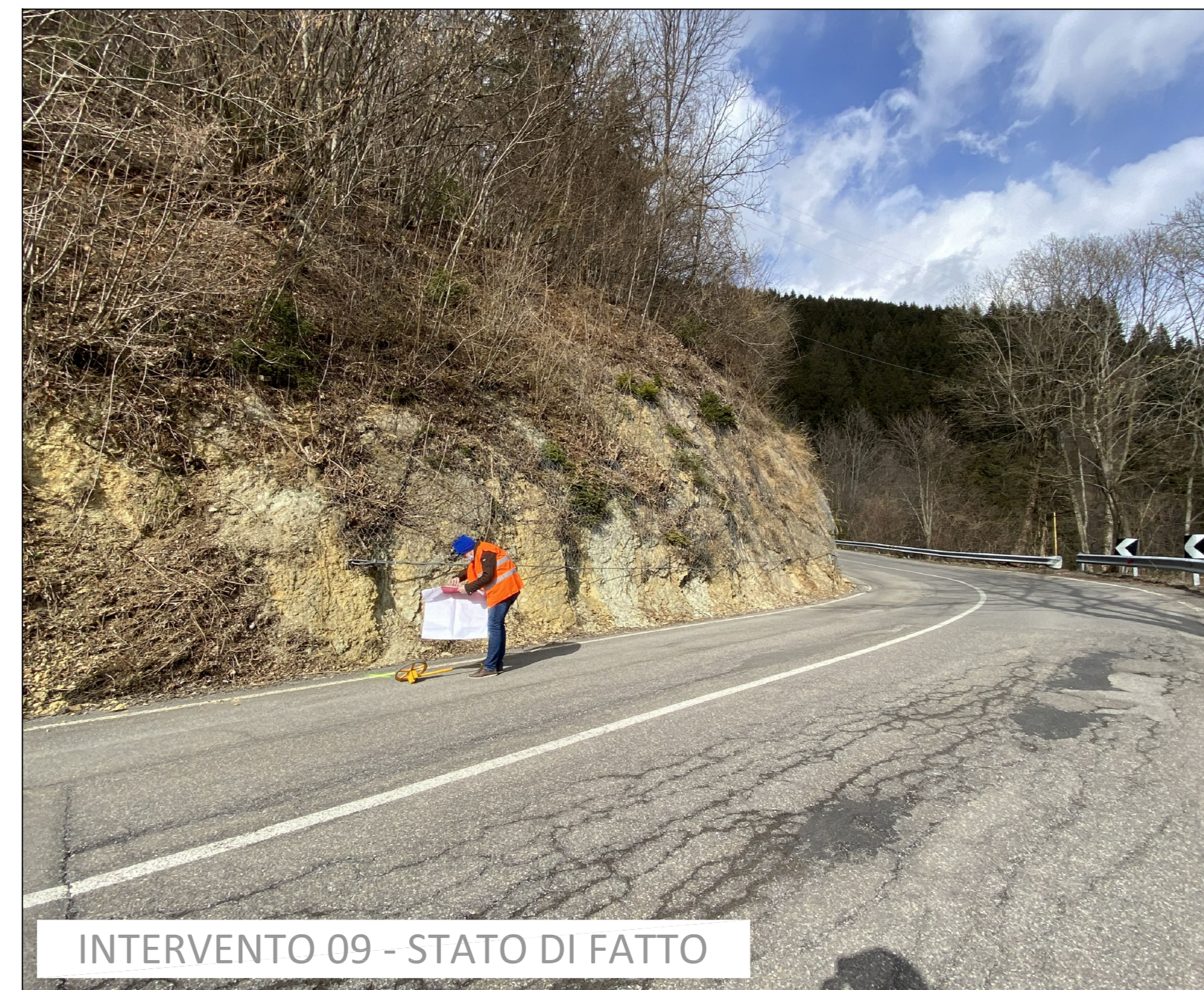
INTERVENTO 09 - STATO DI FATTO