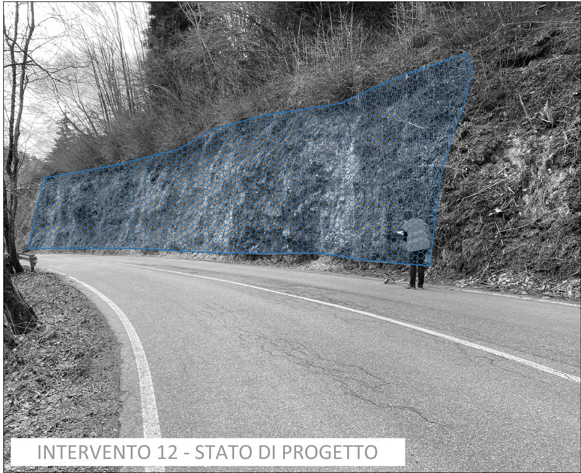
INTERVENTO 12 - STATO DI PROGETTO

N.B.: Gli elementi disegnati sulla fotografia sono da ritenersi puramente indicativi. Per la posa si veda la tavola dei particolari costruttivi. Indicazioni specifiche sull'intervento verranno definite in corso d'opera, in fase di direzione lavori.