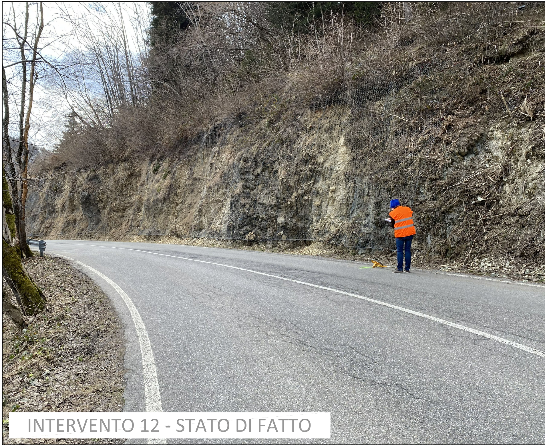
INTERVENTO 12 - STATO DI FATTO

ESTRATTO CARTA TECNICA REGIONALE scala 1:10.000 Per avere indicazioni migliori, durante la cantierizzazione, sulla posizione degli interventi si inseriscono le chilometriche (la chilometrica 0km corrisponde alla fine del muro in cls in località Sola Alta, avente coordinate: WGS84: Lat 45.907897 - Lng 10.035859) INTERVENTO 12 DAL km 1,045 al km 1,069 e dal 1,106 al km 1,174.