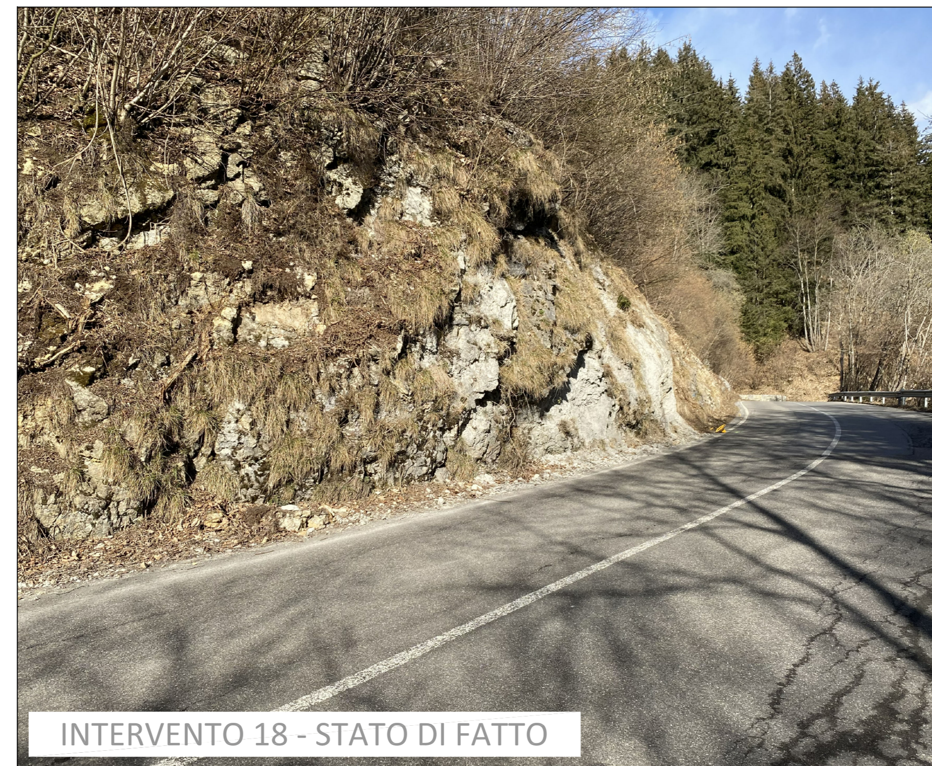
INTERVENTO 18 - STATO DI FATTO