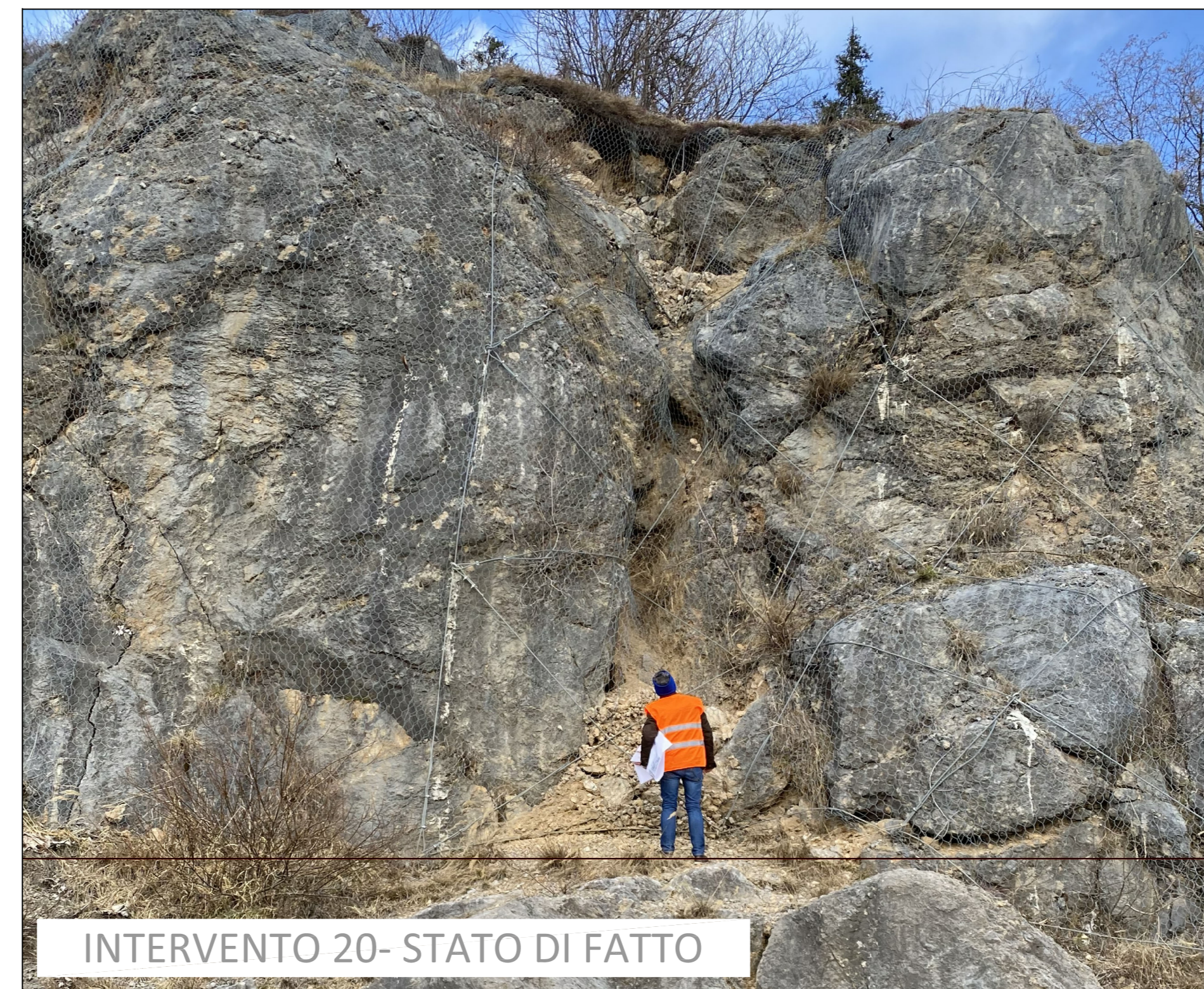
INTERVENTO 20- STATO DI FATTO