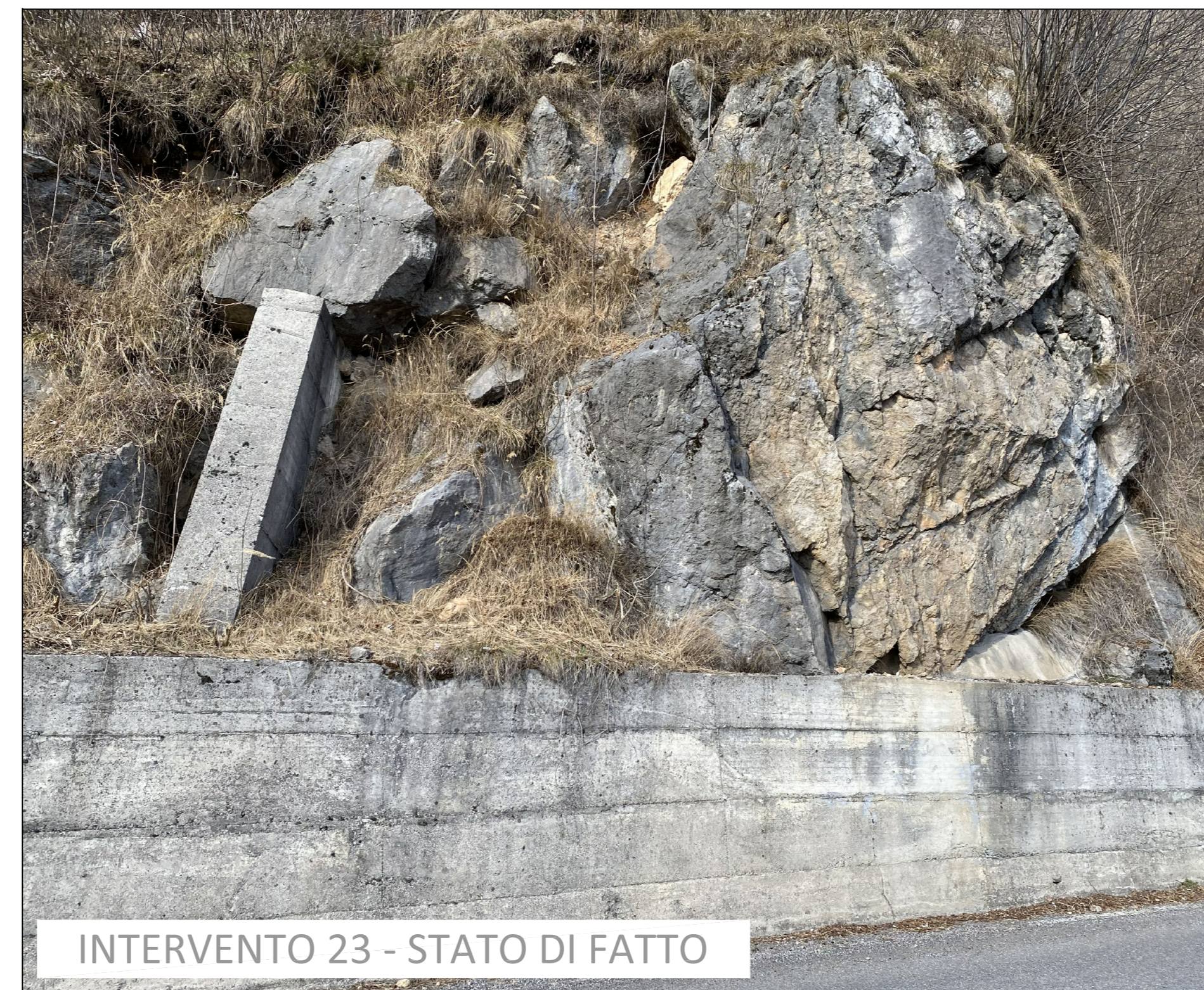
INTERVENTO 23 - STATO DI FATTO