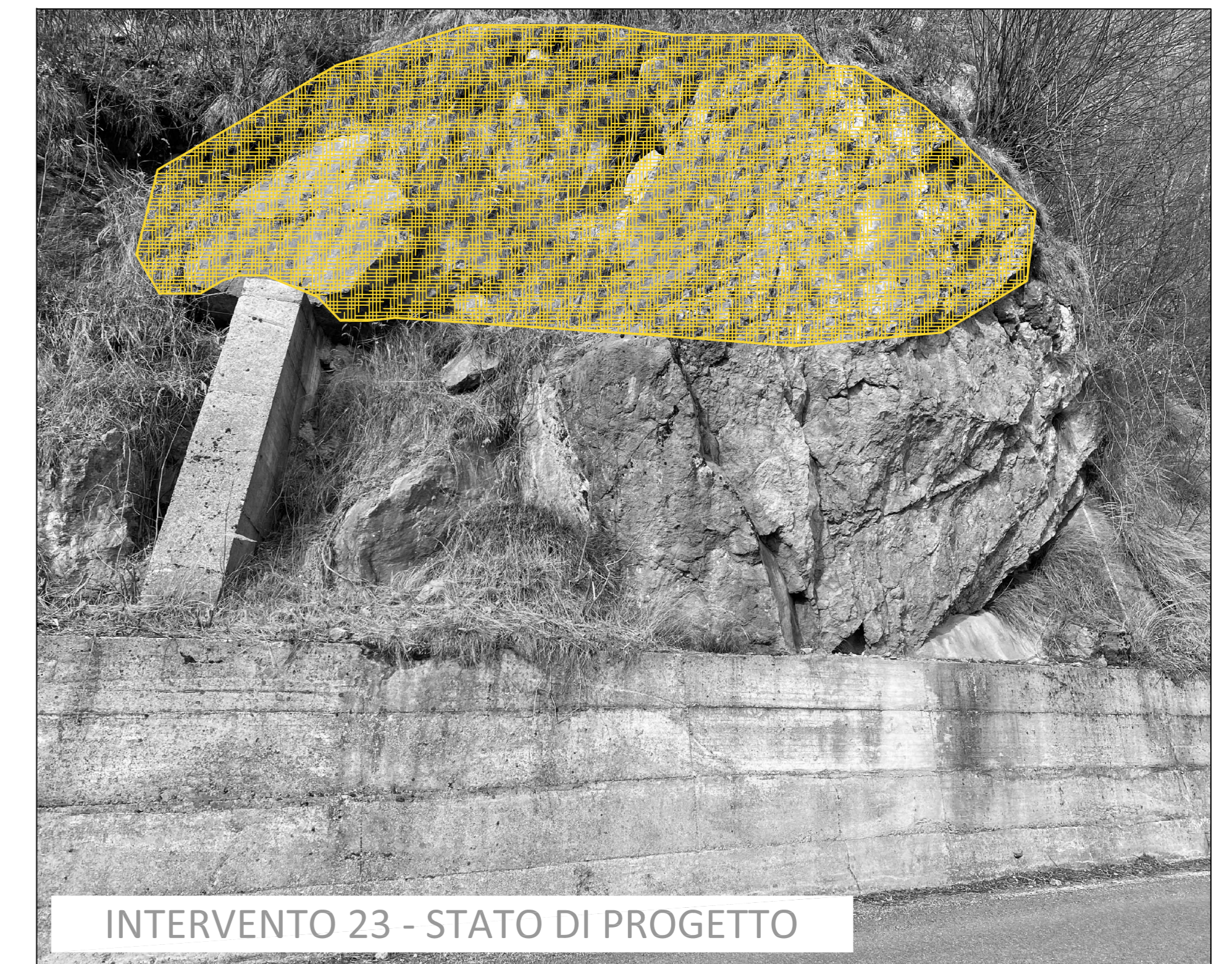
INTERVENTO 23 - STATO DI PROGETTO

ESTRATTO CARTA TECNICA REGIONALE scala 1:10.000